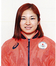
土性沙羅さん (レスリング)